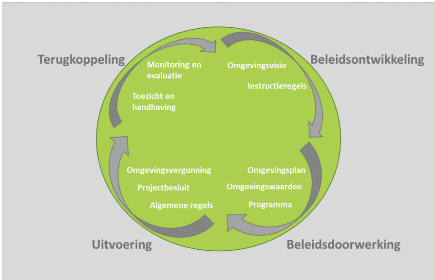
Afbeelding 2 beleidscyclus