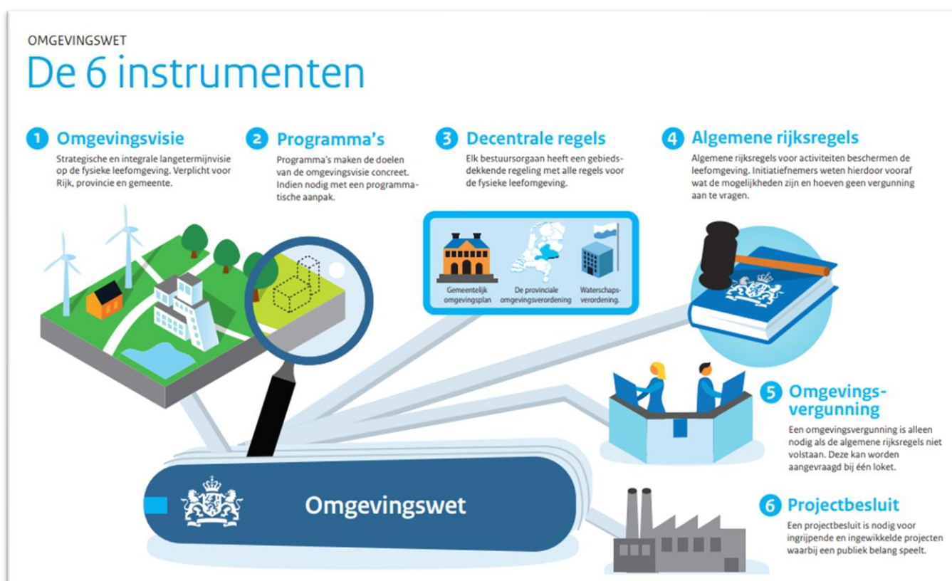
Afbeelding 1 de zes instrumenten van de Omgevingswet

De Omgevingswet kent zes instrumenten. Namelijk de omgevingsvisie, programma's, decentrale regels, algemene rijksregels, omgevingsvergunning en het projectbesluit. In afbeelding 1 staan de instrumenten aangegeven. Het omgevingsplan behoort tot de decentrale regels.