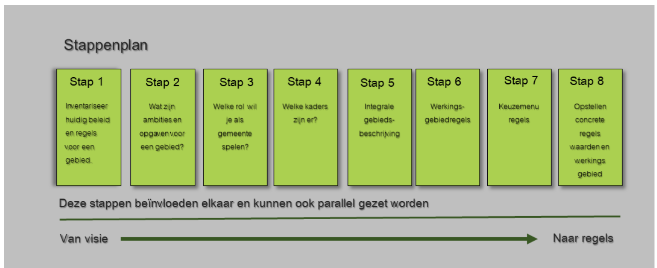
Afbeelding 3 stappenplan om te komen tot een omgevingsplan

De omgevingsvisie wordt in het stappenplan niet genoemd. De omgevingsvisie vormt echter wel een belangrijke basis om te komen tot het omgevingsplan. Daarom wordt deze hier als stap 0 besproken.