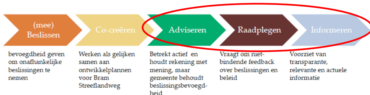
Figuur 3: Participatievormen