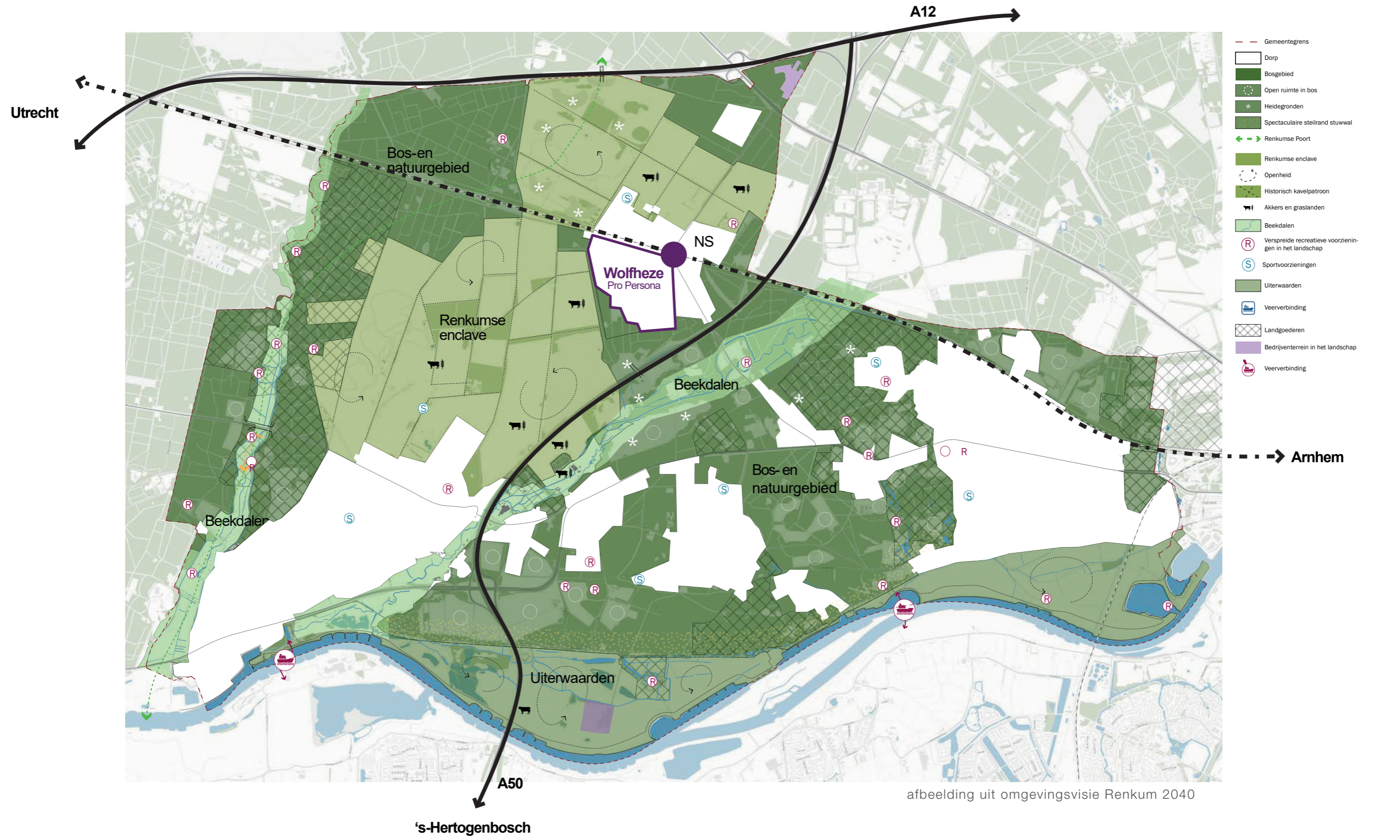
afbeelding uit omgevingsvisie Renkum 2040