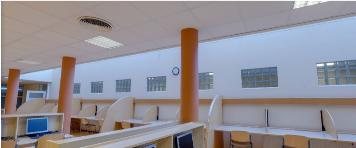
De beschikbare ruimte

In de mediatheek is aan de zijkant een plek waar leerlingen zonder computer aan hun huiswerk kunnen werken. Een alternatief hiervoor is de studieruimte en deze wordt steeds vaker gebruikt omdat het daar stiller is en je je beter kunt concentreren. Daardoor wordt de computervrije ruimte in de mediatheek minder gebruikt en zou daarmee perfect zijn voor de bieb.